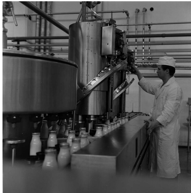
Fabrica de lapte și înghețată, 1973