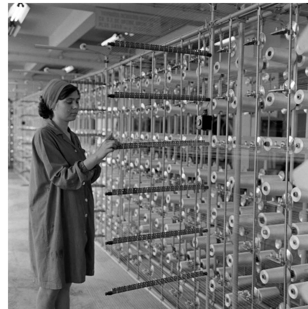
Tricotaje Someșul, 1971

Sándor Ilyés: Cluburi muncitorești la Cluj în anii 1950-1960 (2013)