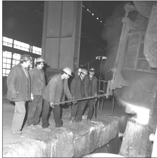
Azonosítatlan gyár, 1987