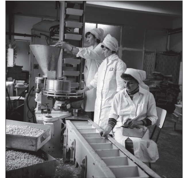
Feleacul Vállalat, 1987