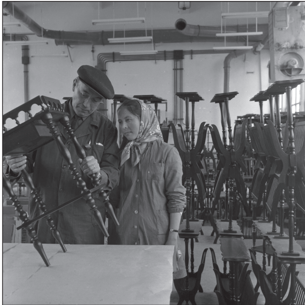
Fűrészüzem, Irisz-telep, 1982